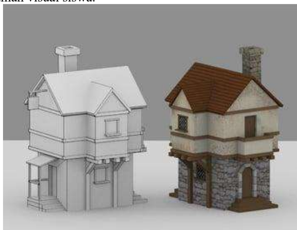
Gambar 3. Modelling dan Texturing [6]

Proses ini melibatkan pembuatan model 3D dari planet-planet dan objek-objek Tata Surya lainnya. Model-model tersebut akan dilengkapi dengan tekstur dan detail yang realistis untuk meningkatkan pengalaman visual siswa.