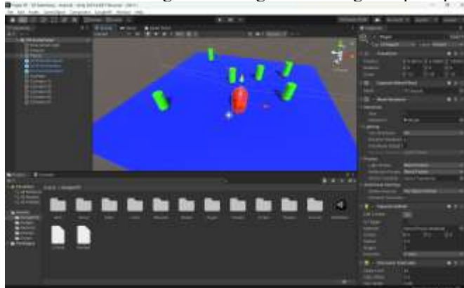
Gambar 4. Tampilan Aplikasi Unity 3D

Aplikasi VR akan dibuat menggunakan Unity 3D dan Google VR SDK untuk pengembangan VR. Unity 3D akan digunakan untuk membangun lingkungan virtual yang menarik, sementara Google VR SDK akan memungkinkan integrasi teknologi VR pada perangkat smartphone.