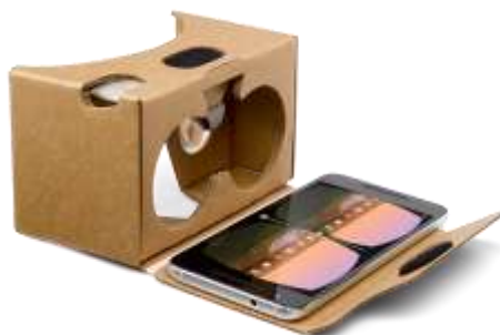
Gambar 5. Penggunaan VR Smartphone Dengan Google Cardboard [8]

Aplikasi yang telah dibuat akan diimplementasikan pada perangkat smartphone untuk memastikan fitur interaktif dan keakuratan visual dalam menggambarkan Tata Surya. Tujuannya adalah memastikan fitur aplikasi berjalan dengan lancar.