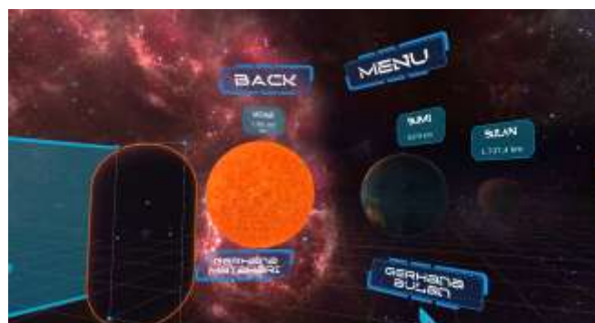
Gambar 12. Tampilan Scene VR Tata Surya dan Scene Informasi Planet