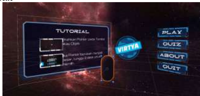
Gambar 10. Tampilan Scene Menu Utama