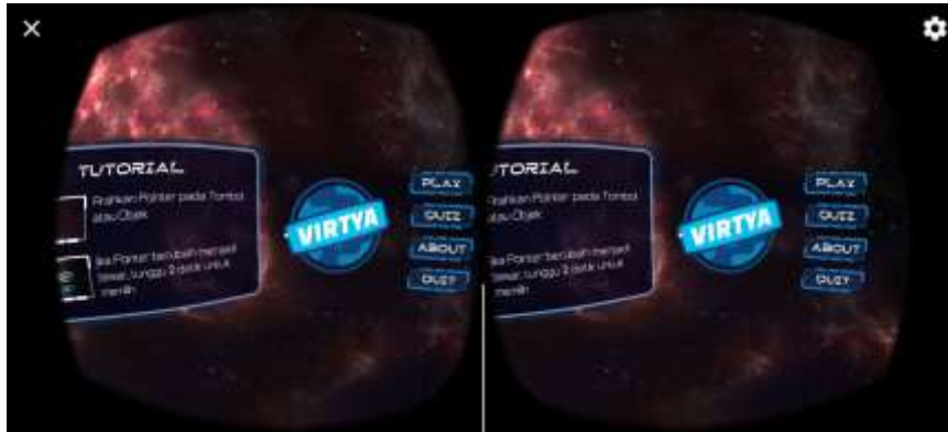
Gambar 13. Tampilan Menu Utama Aplikasi pada Smartphone Android

Penggunaan Google VR SDK pada aplikasi VIRTYA yang dibuat menggunakan aplikasi Unity, memungkinkan aplikasi VR dapat berjalan pada perangkat android. Aplikasi yang dibuat dapat dioperasikan menggunakan alat tambahan berupa Google Cardboard atau dengan VR Box.