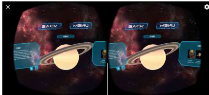
Gambar 14. Tampilan Informasi Planet Aplikasi pada Smartphone Android

Gambar di atas merupakan tampilan aplikasi ketika dijalankan pada perangkat smartphone android, terlihat bahwa layar terbagi menjadi 2. Dengan menggunakan alat tambahan Google Cardboard atau VR Box, maka tampilan yang dilihat pengguna akan menjadi 1. Proses tersebut akan memberikan ilusi optik pada pengguna, sehingga pengguna merasa berada dilingkungan tersebut.