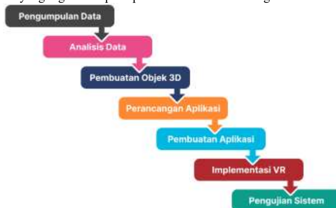
Gambar 2. Metode Penelitian System Development Life Circle

Metode penelitian ini mengadopsi pendekatan System Development Life Cycle (SDLC) yang telah disesuaikan dengan kebutuhan dan tahapan yang diperlukan. Dalam pengembangan sistem, setiap tahapan akan dilakukan secara berurutan. SDLC merupakan proses yang digunakan untuk mengembangkan atau memodifikasi sistem perangkat lunak dengan memanfaatkan model dan metodologi terbaik yang telah teruji sebelumnya [4]. Pendekatan sistematis ini memastikan bahwa setiap fase pengembangan perangkat lunak memiliki kontrol kualitas untuk menghasilkan sistem yang andal [5]. Adapun metode SDLC yang digunakan pada penelitian ini adalah sebagai berikut :