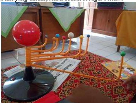
Gambar 6. Miniatur Planet Yang Dimiliki SDN Kesambi Dalam 3

Data ini mencakup informasi lengkap mengenai planet-planet dalam Tata Surya, termasuk karakteristik, jarak dari matahari, ukuran (diameter), serta sifat-sifat khusus masing-masing planet. Informasi ini sangat penting untuk pembuatan model 3D planet yang akan digunakan dalam aplikasi VIRTYA. Beberapa data inti yang dikumpulkan adalah sebagai berikut: