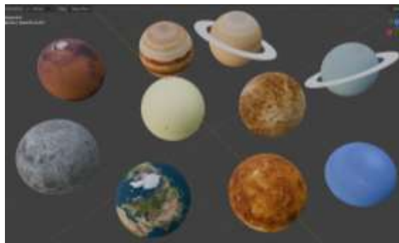
Gambar 7. Objek 3D Planet

Model 3D planet dan objek Tata Surya lainnya telah hampir selesai dibuat. Setiap planet dibuat dengan tekstur dan detail yang realistis, sesuai dengan preferensi visual siswa yang diperoleh dari analisis data. Model ini juga didesain agar membantu siswa dalam memahami ukuran relatif antar planet dan jaraknya dalam Tata Surya.