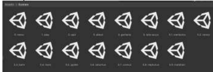
Gambar 9. Kumpulan Scene dalam Unity

membuat sebuah tampilan, mirip dalam pembuatan website, Scene seperti tampilan halaman yang akan dimunculkan pada aplikasi. Dalam pembuatan aplikasi VIRTYA, telah dibuat Scene sesuai dengan Use Case yang telah dibuat. Terdapat total 15 Scene yang berisi Main Menu sampai dengan Scene Informasi Planet-planet.