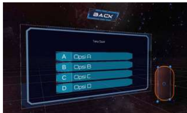
Gambar 11. Tampilan Scene Quiz